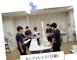
カンファレンス(日勤)