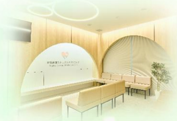
新潟駅前ストレスケアクリニック