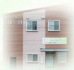
のどか訪問看護ステーション